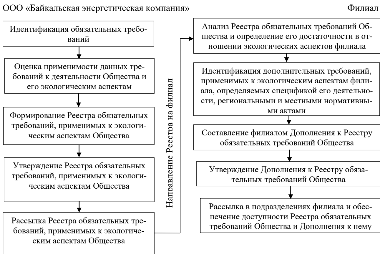
Рисунок 1. Общая последовательность идентификации обязательных требований по ООС, применимых к экологическим аспектам ООО «Байкальская энергетическая компания».

6.1.3.4. Формирование Реестра обязательных требований ООО «Байкальская энергетическая компания» осуществляется путем идентификации законодательных и других требований, применимых к экологическим аспектам ООО «Байкальская энергетическая компания».